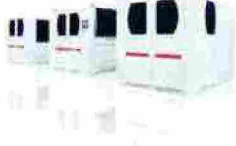
Tapematic presenta IDM II, Inline Decoration Module