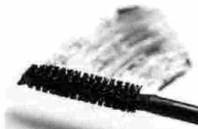
New Mascara Collection by MPlus: love at first sigh