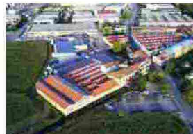
CB Automation, one source supplier