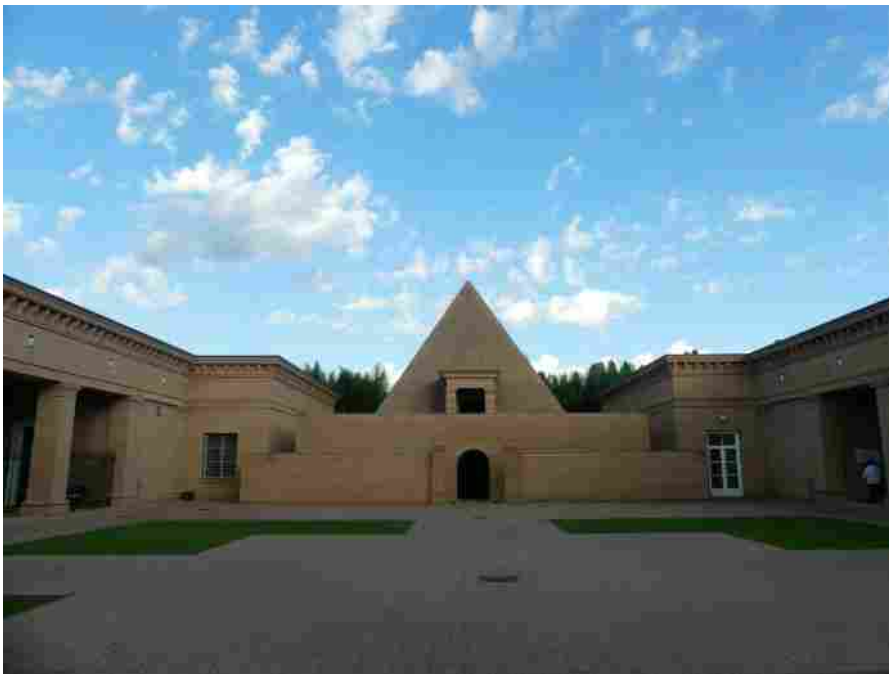
Labirinto della Masone

Un progetto bellissimo, ottimamente realizzato. Chi si è collegato alla piattaforma di We Cosmoprof per seguire in streaming il primo evento virtuale di Alter Ego Italy , della AGF88 Holding, è entrato in una dimensione nuova, capace di guardare all'estetica in un'ottica differente . Un viaggio rigenerante, alla scoperta delle varie pagine che compongono il mondo del brand, tutte accomunate dal desiderio di occuparsi di bellezza in una prospettiva più ampia , che non dimentichi – anzi, prenda avvio – dalle proprie radici interiori.