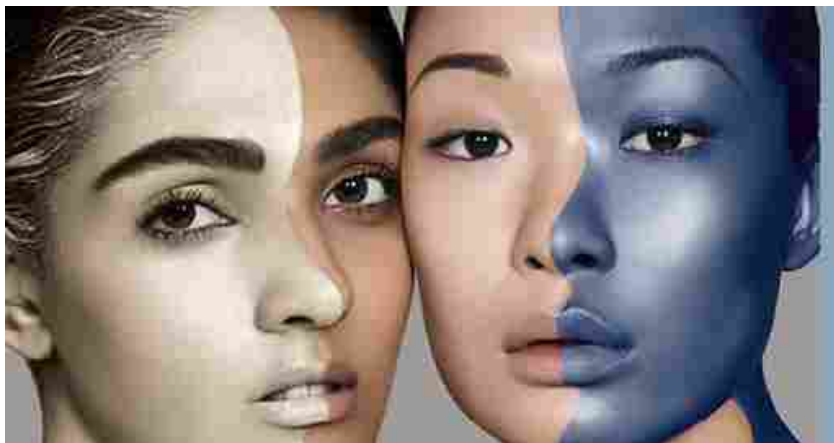
Cosmoprof Cbe Asean

Alla luce delle conseguenze legate alla diffusione del Coronavirus, gli organizzatori di Cosmoprof Cbe Asean , Informa Markets, China Beauty Expo (Cbe) e BolognaFiere, hanno deciso il rinvio della prima edizione della manifestazione a settembre 2021, presso l'Impact Convention and Exhibition Center di Bangkok, in Thailandia.