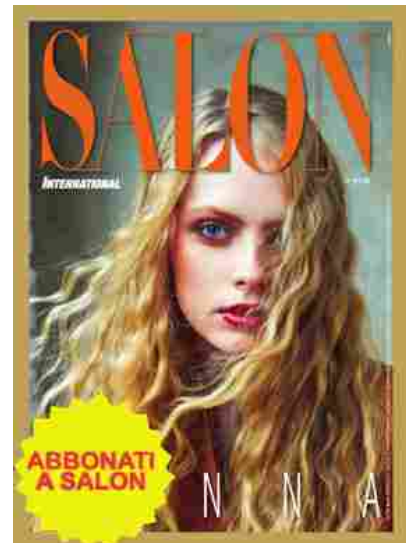
Sfoggia l'estratto di Salon Donna

Questo sito usa Akismet per ridurre lo spam. Scopri come i tuoi dati vengono elaborati.