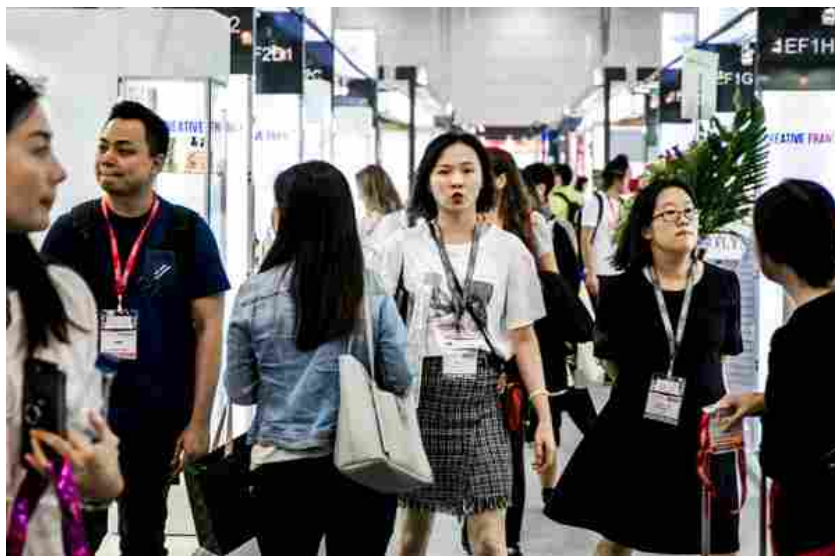
Immagine dell'ultima edizione di Cosmoprof Asia a Hong Kong

Cosmoprof Asia Ltd , joint-venture tra il Gruppo BolognaFiere e Informa Markets , ha annunciato il posticipo di Cosmopack e Cosmoprof Asia 2020 , originariamente in programma dall'11 al 13 novembre presso l'Hong Kong Convention and Exhibition Centre (HKCEC). La principale fiera internazionale nel continente asiatico che rappresenta tutti i principali settori dell'industria cosmetica tornerà 'fisicamente' nel novembre 2021. Nel frattempo, Cosmoprof Asia riafferma il suo ruolo di piattaforma di riferimento per attività B2B di alta qualità nella regione Asia-Pacific, offrendo quest'anno un evento digitale con un ricco programma di contenuti.