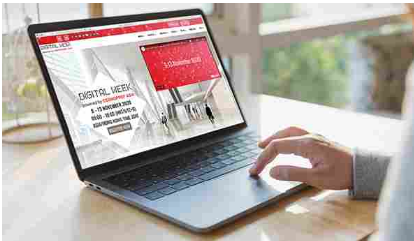
Cosmoprof Asia Digital Week

Si inaugura oggi la prima edizione di Cosmoprof Asia Digital Week , l'evento online dedicato ad aziende e operatori alla ricerca di nuove soluzioni di business nella regione Asia-Pacific. Da oggi al 13 novembre, 640 espositori potranno relazionarsi in totale sicurezza con più di 10.000 buyer da 104 Paesi, per rilanciare contatti di business, condividere nuovi progetti, definire ordini commerciali e valutare tendenze e strategie per rispondere alle sfide imposte dalla pandemia. Grazie a investimenti e progetti speciali da parte di governi locali per supportare l'industria cosmetica in questo complicato scenario economico, 15 collettive nazionali partecipano a Cosmoprof Asia Digital Week: Italia (ITA - Italian Trade Agency), Spagna (Icex), Grecia (Enterprise Greece), Svizzera (Switzerland Global Enterprise), Polonia (Polcharm), Regno Unito (Birmingham Chamber of Commerce), Cina (Guangzhou Municipal Commerce Bureau e Yiwu Municipal Bureau of Commerce), oltre a 7 padiglioni per la Corea (con il supporto di Kotra, Ibita -International Beauty Industry Trade Association, Kif - Korea Innovation Foundation, Kobita - Korea Beauty Industry Trade Association, Kosme Jeju - Korea Smes e Startups Agency Jeju, Snip - Seongnam Industry Promotion Agency e Wmit - Wonju Medical Industry Techno-Valley).