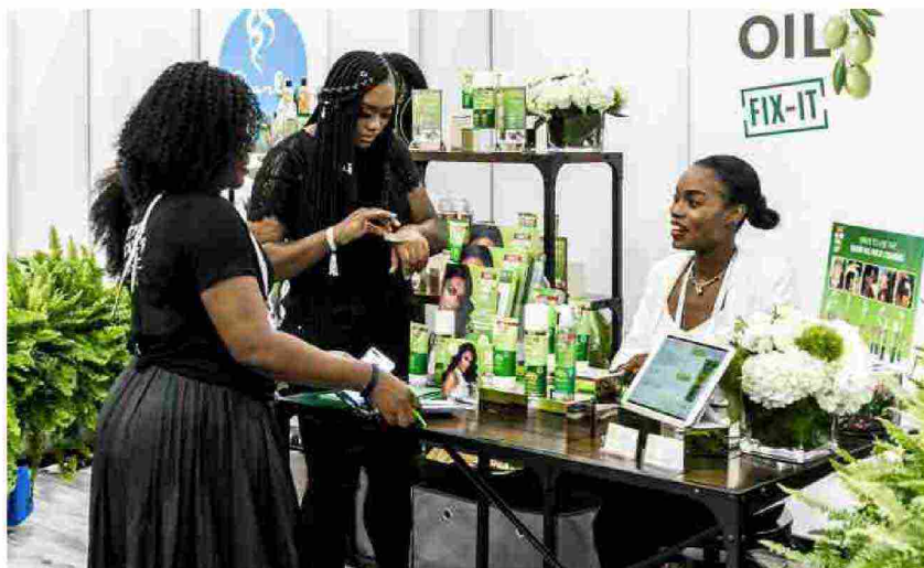
Immagine della scorsa edizione di Cosmoprof North America

La 18ema edizione di Cosmoprof North America è stata posticipata e si terrà dal 20 al 22 settembre 2020. A seguito dei recenti sviluppi legati alla diffusione del Coronavirus nel mondo, gli organizzatori (BolognaFiere e Professional Beauty Association) hanno preferito riprogrammare la manifestazione, a tutela della community e dello staff coinvolti durante l'evento.