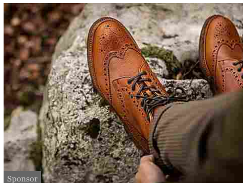
Velasca: Il loro modello di business è geniale.