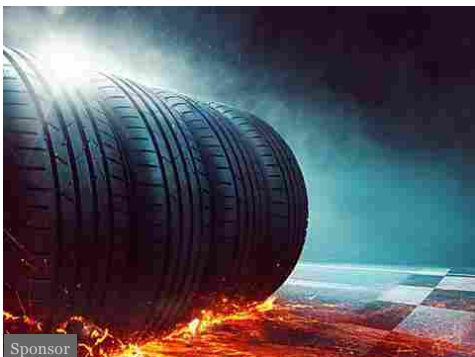
I prezzi online dei pneumatici potrebbero